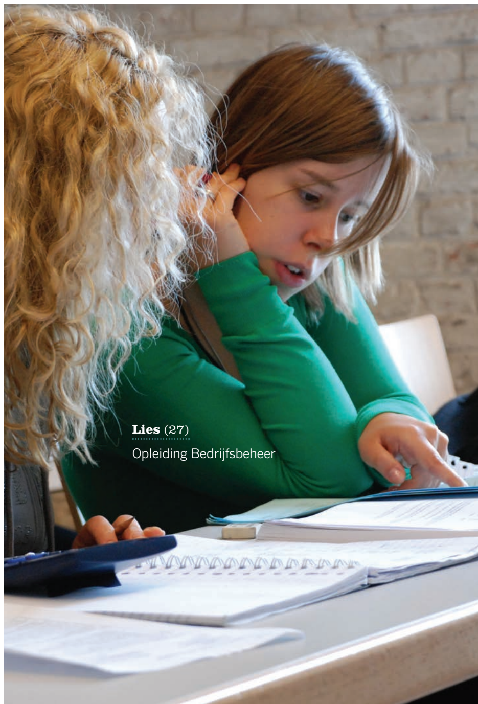
Lies (27) Opleiding Bedrijfsbeheer